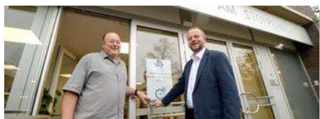
Begrüßung der Gäste

Der Deutsche Ganztagschulkongress 2016 hat am Stoppenberg stattgefunden. Wir waren als Mitveranstalter eingebunden und für die drei Kongresstage war unsere Schule der Dreh- und Angelpunkt für die Kongressteilnehmerinnen und Kongressteilnehmer, die aus allen Bundesländern zu uns ins Ruhrgebiet gereist sind.