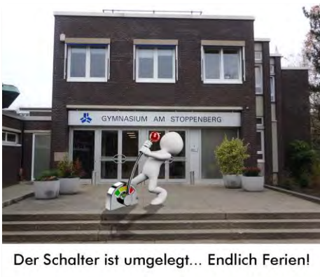
Der Schalter ist umgelegt... Endlich Ferien!

So, und jetzt machen wir uns auf den Weg in die Sommerferien. Hinter uns liegt ein ganz besonderes Jahr, hinter uns liegt die erste Hälfte unseres Jubiläumsjahres 2016. Im Vorfeld haben wir uns viele Gedanken gemacht, wie es wohl sein würde und was wir wohl erleben würden. An vielen Stellen im Newsletter habe ich meine persönlichen Eindrücke unserer Veranstaltungen deutlich gemacht. Ich hätte mir dieses Jubiläumsjahr bislang nicht schöner vorstellen können. Jede Veranstaltung für sich war ein besonderes Erlebnis, viele Begegnungen mit Ehemaligen und Freunden des Stoppenberg haben bereits in der ersten Hälfte des Jahres zu einem noch intensiveren „Wir-Gefühl“ geführt, als ich es bisher erlebt habe.