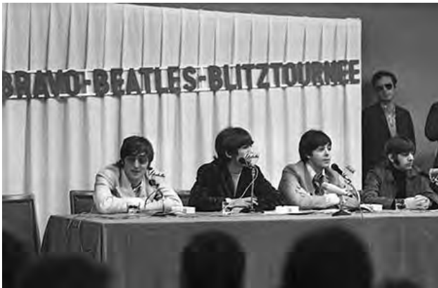
Die Beatles geben 1966 zwei Konzerte in der Grugahalle

Wie war das wohl zu Beginn des Kalenderjahres 1966, als im Bistum Essen die Planungen zur Eröffnung des Gymnasiums Am Stoppenberg als Tagesheimschule kurz vor ihrem Abschluss standen? Welche Vorbereitungen wurden getroffen? Welche Probleme galt es zu lösen? War man sich dessen bewusst, dass man zum ersten Mal in Nordrhein Westfalen ein Gymnasium in einer verpflichtenden ganztägigen Form anbieten würde und damit seiner Zeit weit voraus sein würde? Wie viele Schüler wurden aufgenommen? Wie lief das Auswahlverfahren? Wie wurde im Essener Norden diese Schulgründung wahrgenommen?