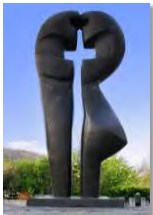
Skulptur von R. Scheurer

Liebe Schülerinnen und Schüler, liebe Eltern, liebes Kollegium!