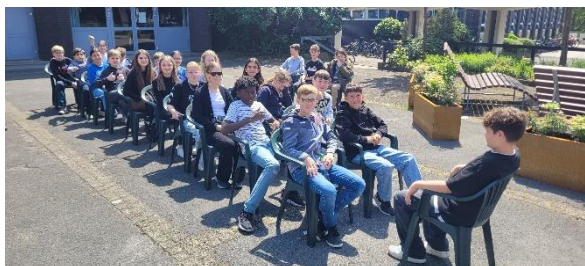
Trockentraining der Klasse 6b auf dem oberen Markt

Am Dienstag, den 06. Juni 2023, begibt sich die gesamte Schulgemeinschaft des Gymnasiums Am Stoppenberg zum Baldeneysee, um dort den Drachenboottag zu erleben. Nach den Trainingseinheiten, die inzwischen stattgefunden haben, erwarten wir spannende Rennen in den verschiedenen Altersklassen.